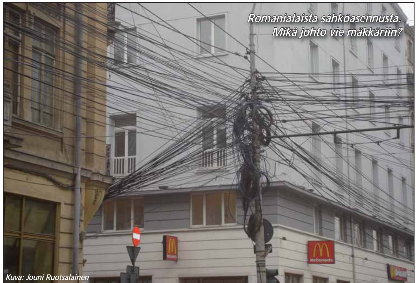
Romanialaista sähköasennusta. Mikä johto vie mäkkäriin?